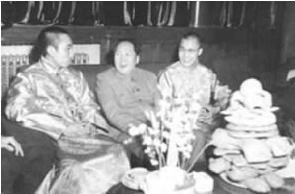
Mao, Panchen Lama, & Dalai Lama. Peking, 24. Februar 1955.